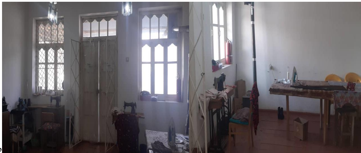
Рис2 . Фотография объекта.