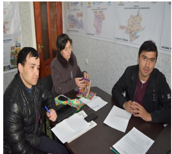
Офис ОО «Латиф», г.Худжанд, Согдийской области 01.02.2021