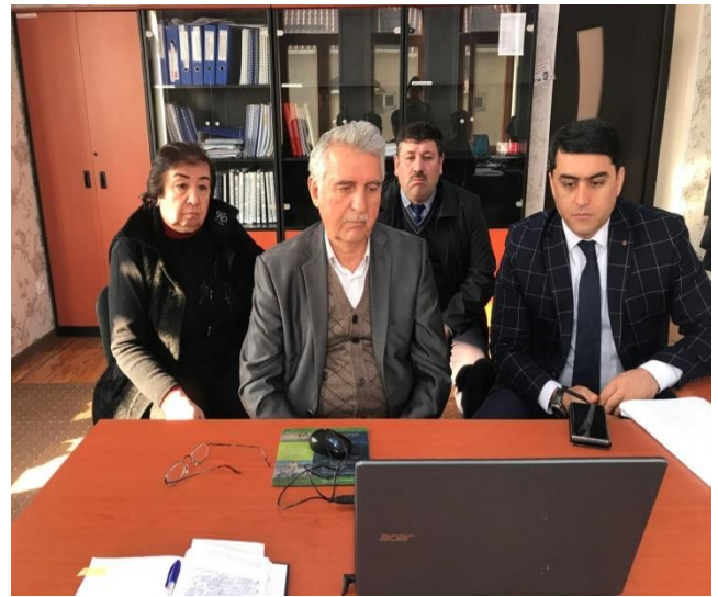
Офис ГУ РПСХ, г. Душанбе, 01 02 2021.