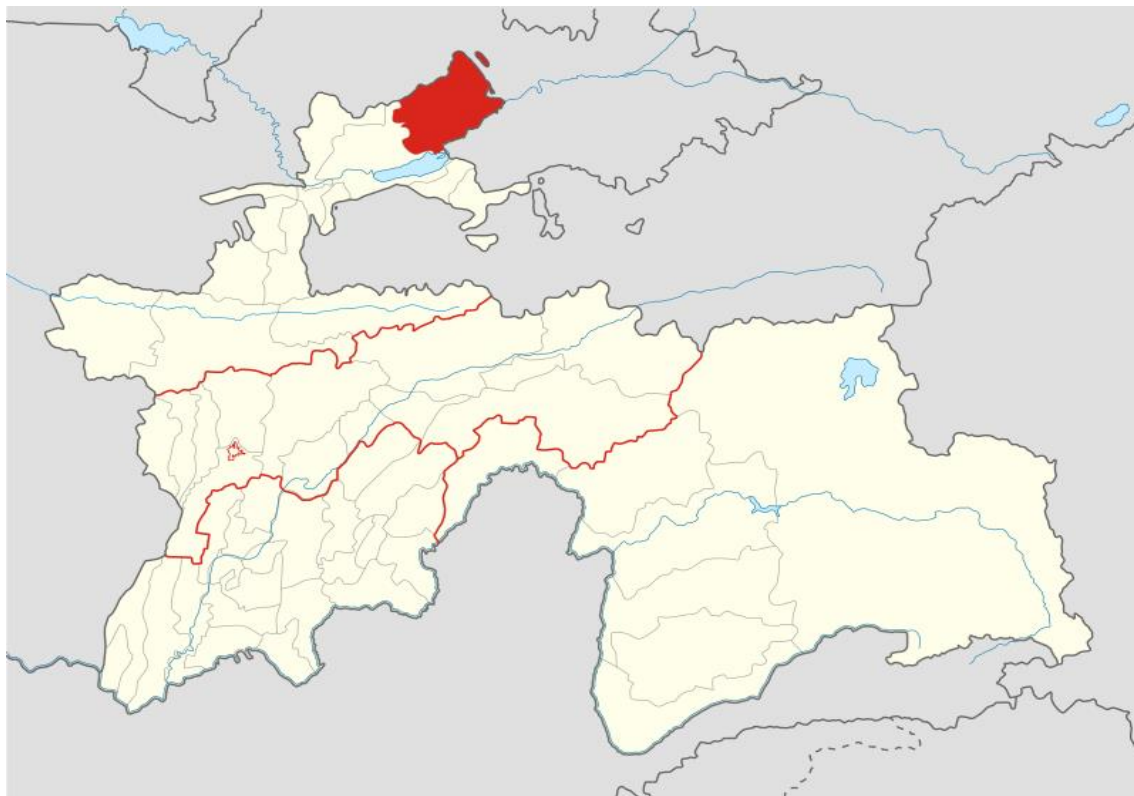
Рис.1 Расположение Аштского района на территории Республики Таджикистан

плюс 42°С (в середине июля) и минимальная в зимний период – минус 20°С (в середине декабря).